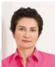
Alev Korun Abgeordnete zum Nationalrat Migrations- und Menschenrechtssprecherin der Grünen

Ich wünsche Ihnen spannende, anregende, vielleicht manchmal verstörende, manchmal spaßige Kinomomente und stunden mit BLICK.WECHSEL. Auf viele weitere Blickwechsel!